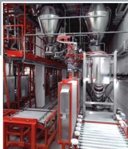
Containerbefüllung mit KAD – KOKEISL